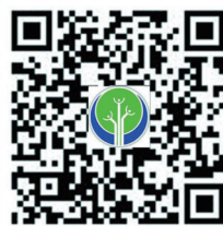
阜新市就业服务中心