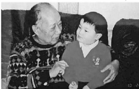
方冰给外孙讲王二小的故事

1946年，时任晋察冀热辽军区文工团总团长的安波在热河军区工作时，听这个村干部讲述亲身经历，连夜给李劫夫写信：“你应该紧握你手中的笔杆，不，不是笔杆，而是一挺千金难买的重机枪，我相信在全国人民解放之