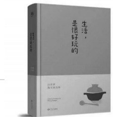
《生活，是很好玩的》 作者 汪曾祺 出版社 江西人民出版社

栗子熟食的较多。我的家乡原来没有炒栗子，只是放在火里烤。冬天，生一个铜火盆，丢几个栗子在通红的炭火里，一会儿，砰的一声，蹦出一个裂了壳的熟栗子，抓起来，在手里来回倒，连连吹气使冷，剥壳入口，香甜无比，