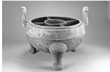
西汉铜分格鼎 尺寸：鼎身口径400毫米 高160毫米