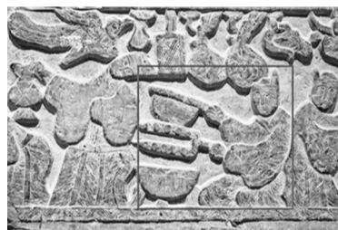
临沂五里堡汉画像石——《庖厨图》

火锅在中国的历史非常悠久，早在商周时期，人们就造出了现代火锅的原型。比如出土于陕西宝鸡的西周“有盘鼎”。这个鼎有个下盘，可以放炭火加热，吃饭的时候方便将火源和菜品一起端到桌上，类似今天的一人食小火锅。