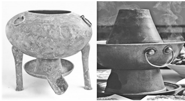
海昏侯墓出土的青铜三足鼎(左)与现代涮肉铜锅(右)相似

采诗官大概算一种。在周朝，采诗官们巡游各地，采集民间的诗歌、歌谣。《诗经》中的大部分作品就由他们采集而来。工作的同时，他们可以顺便了解各地的风俗人情，看遍各地的好山好水，结交五湖四海的朋友，确实让人羡慕。他们可以说是古代的吟游诗人，既会作词，又会作曲，用一身的才华，从事一份颇为浪漫的工作，这样的人生态度也很励志。（据央视）